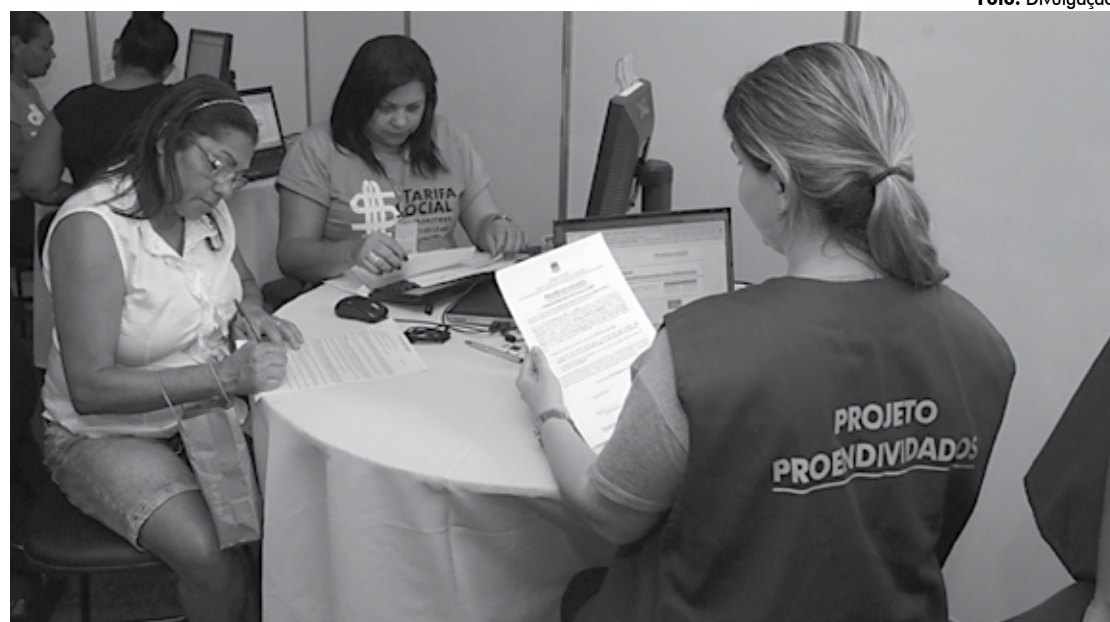
As pessoas convidadas para participar do programa são consumidores que possuem duas ou mais faturas pendentes