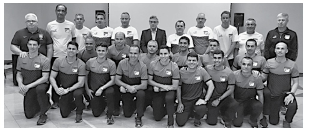
Árbitros e assistentes estão sendo trabalhados para entrar em ação na rodada do dia 18 de outubro