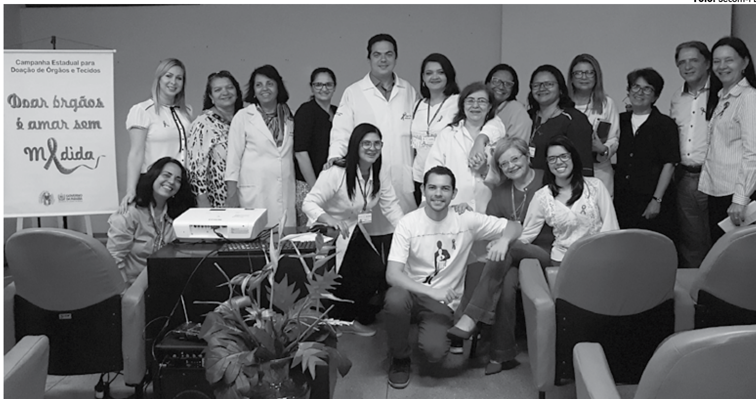
Campanha "Doar órgãos é amar sem medida" ocorre até amanhã no Hospital Estadual de Emergência e Trauma Senador Humberto Lucena, em João Pessoa