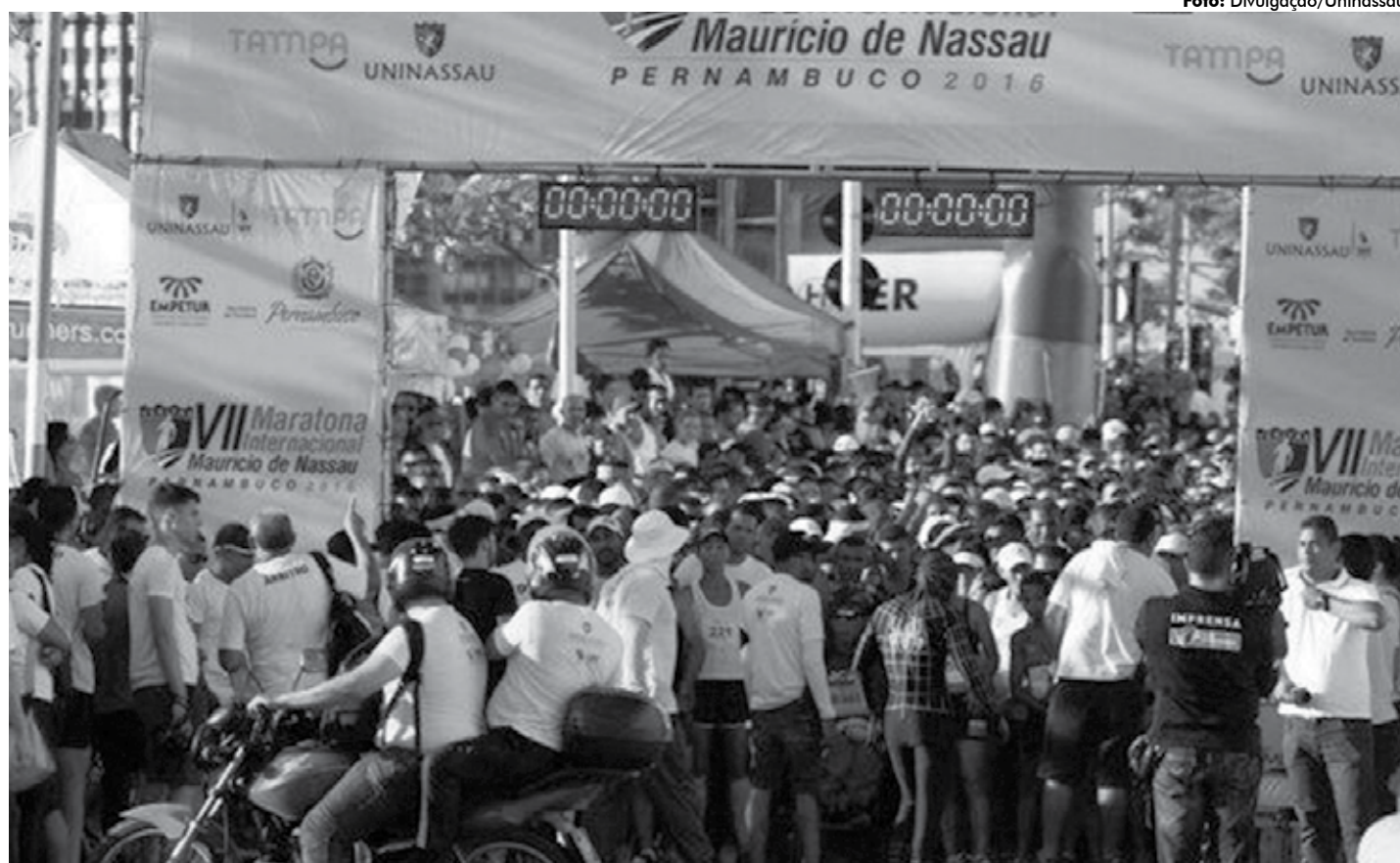
A largada da prova vai acontecer no Cais da Alfândega, no Recife Antigo, a partir das 6h do próximo domingo e são esperados cinco mil corredores

Salvo as funções nos postos de saúde, que precisam ser desenvolvidas por candidatos da área como