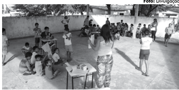
Os SCFV oferecem três refeições diárias, além de atividades culturais

Dentro dos objetivos do Serviço estão os de complementar as ações da família e da comunidade na proteção e desenvolvimento, fortalecendo vínculos familiares e sociais; assegurar espaços de referência para o convívio grupal, comunitário e social; possibilitar a ampliação do universo informacional; estimular a participação na vida pública do território; e contribuir para a inserção,