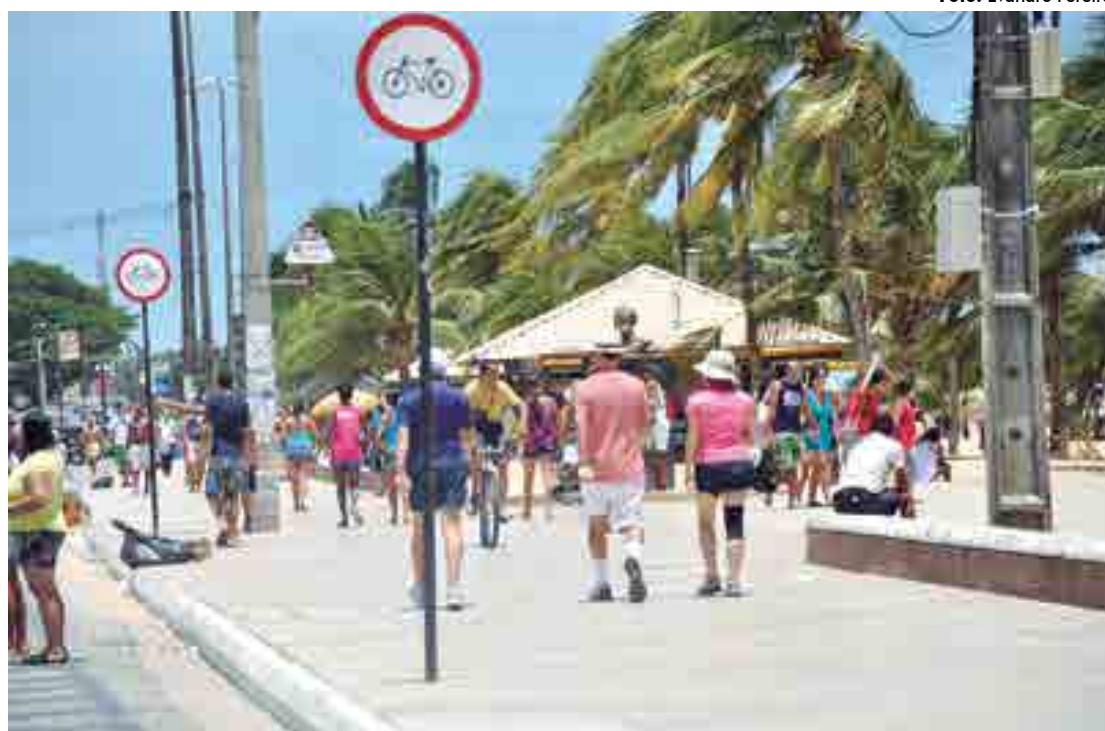
Ser homem, jovem, branco, sem deficiência e de alto nível socioeconômico significa praticar muitos mais atividade física

O Distrito Federal (50,4%) é a unidade da Federação em que as pessoas mais praticam atividade física, enquanto Alagoas (29,4%) tem o menor percentual. "Os dados analisados reforçam a compreensão de que realizar atividade física e esportiva não se restringe somente a