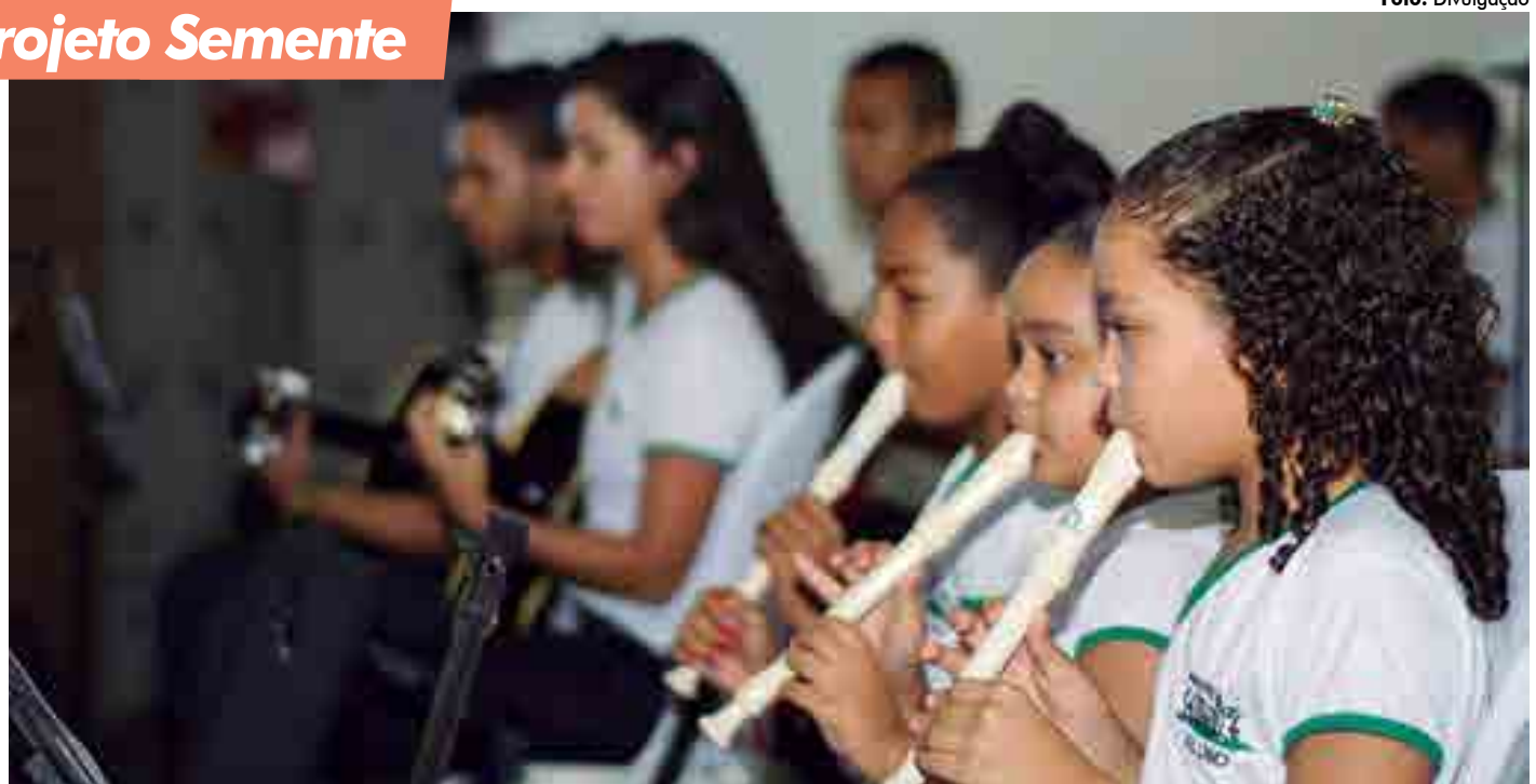
Criado em 2011, o projeto social contribui para a cultura e estimula crianças e adolescentes com aulas de teclado, violão, flauta doce e violino